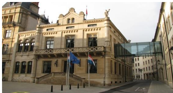
Stor-hertugdømmet Luxembourgs parlament

10.30 Resten af formiddagen til egen disposition.